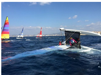
C'est qui? ....ben Sw.....!!!