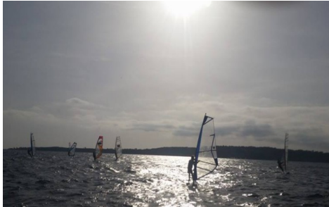
Les îles de Lérins pour horizon